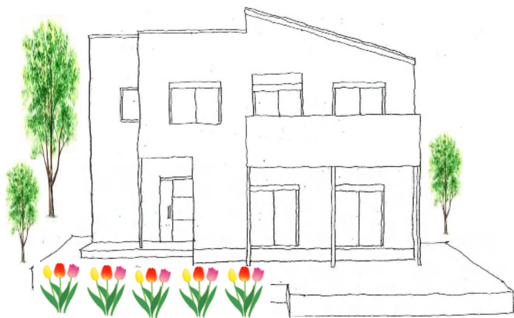
K邸 延床面積 128.90㎡ (38.99坪)